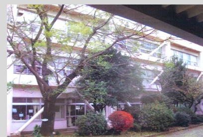
市立小学校(アルミブレース工法)