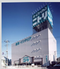
商業施設(ニトリ松戸サニーランド店)