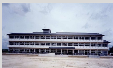
野田市立関宿小学校