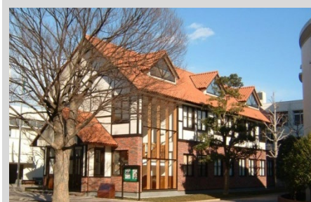
私立高校特別教室