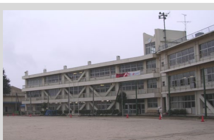
市立中学校(ピタコラム工法)