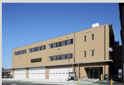
松戸市中央消防署